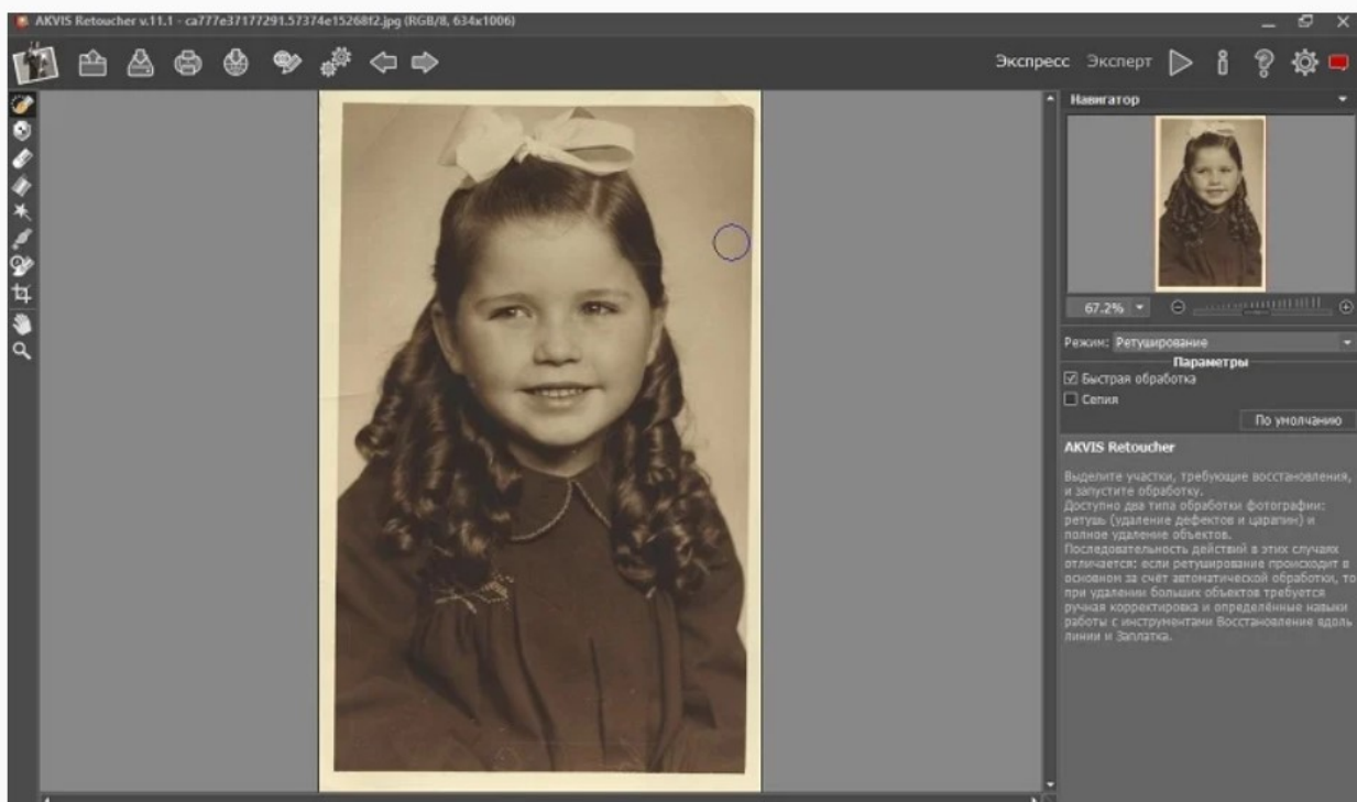
Главное окно редактора в режиме Экспресс

Akvis Retoucher 11.1 совместима со всеми версиями Windows 32 и 64-bit и доступна к скачиванию как отдельная программа, плагин для фоторедакторов и установочный файл с обоими версиями. Программа показала высокую скорость работы на ПК и небольшую нагрузку на процессор.