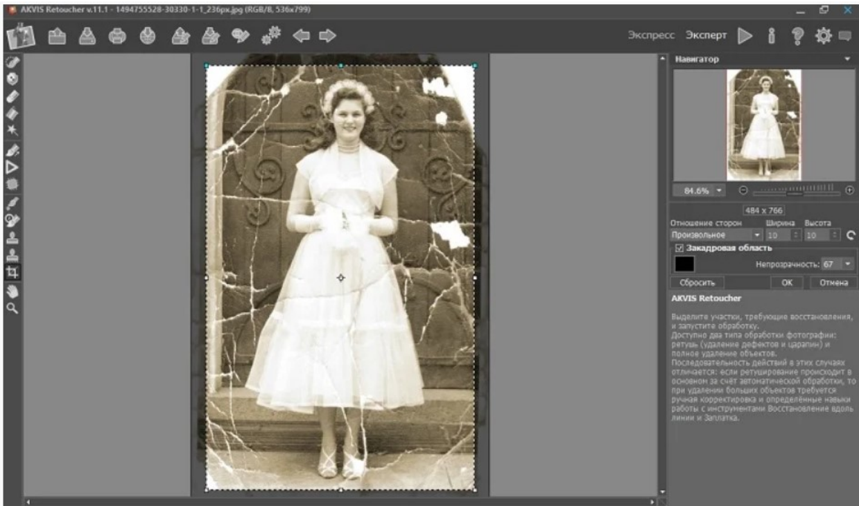
Кадрирование фото в программе